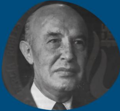
Alfonso García Robles