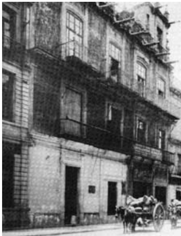
Calle de Don Juan Manuel, actualmente conocida como República de Uruguay.

pleo, por vacante o nueva creación, en las oficinas de la administración pública a los alumnos que cursaran todas las clases establecidas en esta Escuela, solicitando exclusivamente como requisito que fuera egresado de dicha escuela, ser un ciudadano honrado y tener un buen comportamiento para desempeñar dignamente algún cargo dentro de la administración pública (Mendieta y Carrera, 1983: 34; Rodríguez Álvarez, 2000: 28). A la Escuela Especial de Comercio se le denominaba Especial porque se consideraba como especiales a las instituciones que brindaban estudios que habilitaban para carreras y profesiones que no estaban sujetas a la recepción de