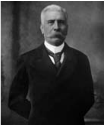
Con la llegada de Porfirio Díaz al poder se impulsó el desarrollo industrial y comercial en casi todo el territorio nacional.

Para enero de 1869, la Cámara de Diputados expidió un decreto cuyo Artículo 5 proponía: “Reformar la Escuela Especial de Comercio del modo que sirva a la vez de Escuela de Administración”; en marzo del mismo año se efectuó una reforma a la ley de 1867.