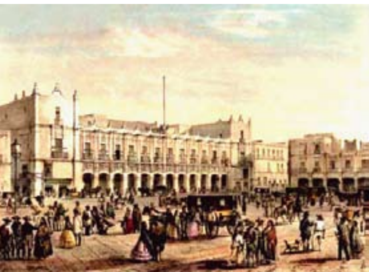
Edificio de Ayuntamiento, 1855.

Para 1853, por iniciativa de Antonio López de Santa Anna, se creó la Secretaría de Fomento, Colonización, Industria y Comercio, que tenía como principales ocupaciones la formación de la estadística general, de la industrial, agrícola, minera y mercantil y las medidas conducentes al fomento de todas las ramas