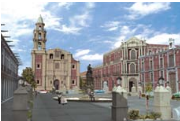
Edificio de la Secretaría de Educación Pública.

Si el interés particular representa, en la reforma de la enseñanza agrícola, un papel importantísimo, en lo que se refiere a la educación mercantil, es predominante. A él hemos acudido y, por fortuna, nos salió al encuentro la iniciativa de un hombre de bien que ha puesto su talento, su energía y sus recursos al servicio del progreso de su patria, en una de sus formas más fecundas. Desviar una parte de la corriente juvenil hacia carreras lucrativas independientes del Estado, es un obra magna y necesaria; recobrar una buena parte de esa corriente que se dirige a las escuelas del extranjero, sobre todo a las norteamericanas, es de primera utilidad, y educar a los hombres que deban reconquistar nuestra supremacía comercial no fuera, sino dentro de nuestro propio país, es una obra meritísima. Vamos a poner todo nuestro esfuerzo en ayudar a realizarla y la cooperación será bajo condiciones amplias y liberales, que merecerán vuestras meditaciones y conquistarán, seguro estoy de ello, vuestra alta aprobación (Rodríguez Álvarez, 2000: 77, apud. Boletín Instrucción Pública 1903 ).