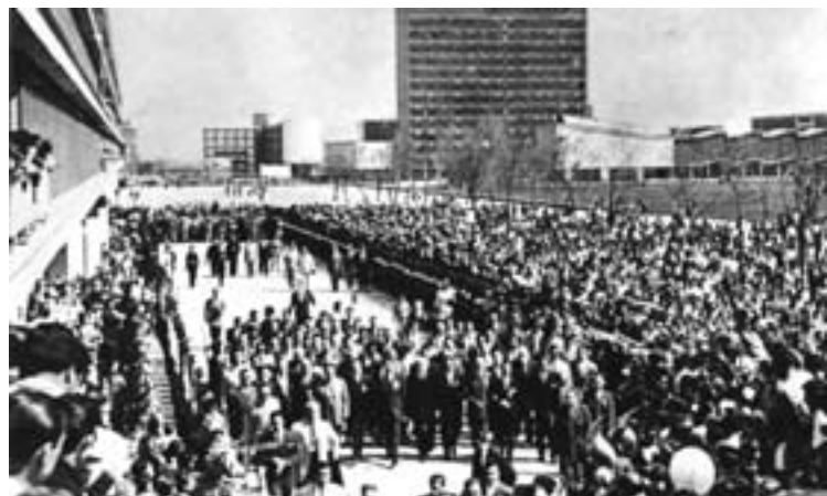
Fotografía que muestra uno de los momentos vividos durante la inauguración de Ciudad Universitaria.