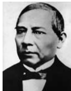
Don Benito Juárez García, abogado y político mexicano, Presidente de México en varias ocasiones.