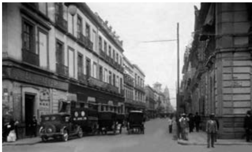
Antigua Calle del Ángel, actualmente, Isabel La Católica.

El Instituto Comercial se encontraba en el centro de la Ciudad en la Calle del Ángel núm. 5, actualmente Isabel La Católica esquina con Uruguay; al abrirse esta institución los alumnos que ingresaron eran aprendices o dependientes de los comercios de la ciudad o hijos de comerciantes que se encontraban matriculados en la Junta de Fomento. El programa de estudios que se propuso sólo constaba de cuatro cursos: “Perfección de la escritura y de la ortografía, y principios generales de geografía comercial; Aritmética comercial y contabilidad en partida simple y doble; Idioma inglés; Idioma francés” (Rodríguez