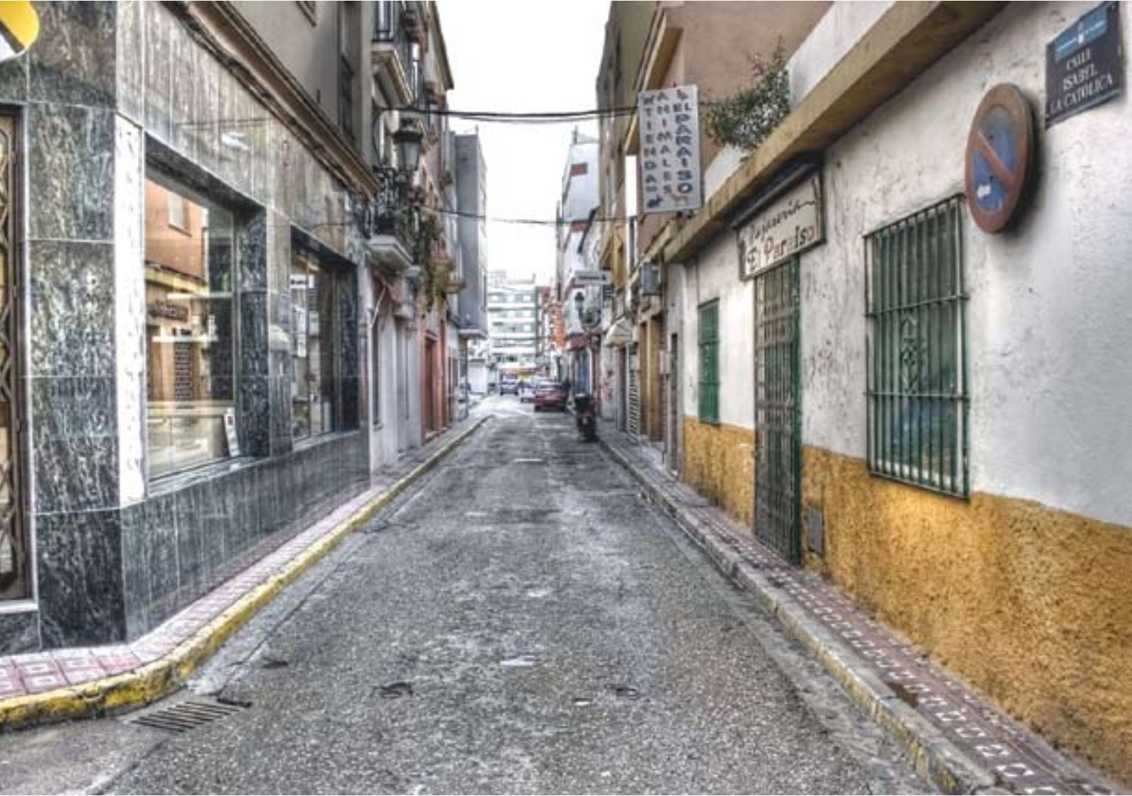
En la placa de la calle se muestra el nombre de la calle Isabel La Católica como se veía hace ya varios años.

Álvarez, 2000: 22); cada uno de ellos estuvo programado para ser estudiado en un año. Lamentablemente, las tensiones políticas por las que en ese momento atravesaba México, derivadas por la intervención norteamericana, las pugnas internas del país y la falta de recursos determinaron la fugaz perma-